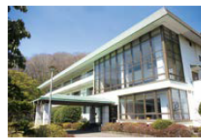
直営 ベネフィット・ステーション 箱根宮城野 5,790 円(素泊り)～/人