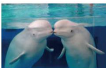
横浜・八景島シーパラダイス