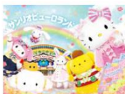
APPROVAL No.P1505304