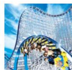
ナガシマスパーランド