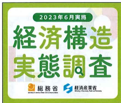
300 × 250 px