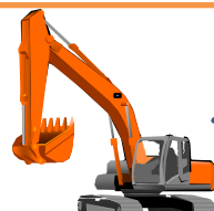
ハイブリッド油圧ショベル