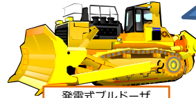
発電式ブルドーザ