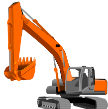
ハイブリッド油圧ショベル